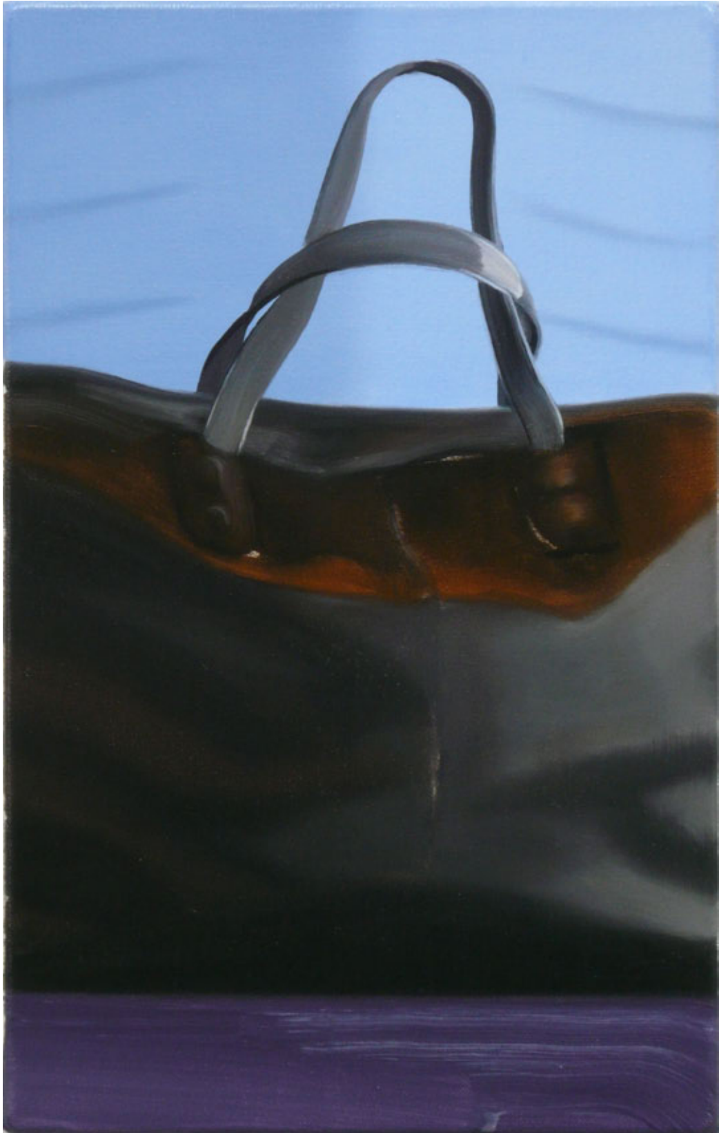
Tasche , 2012 Öl/Leinwand 41 x 26 cm