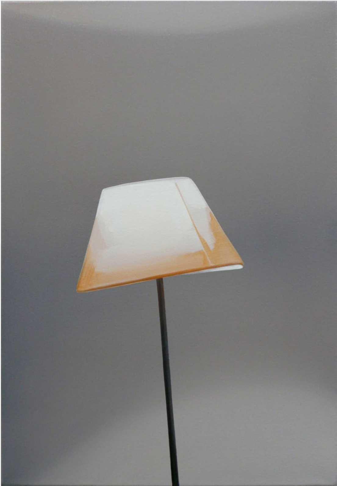
Schiefe Lampe , 2011 Öl/Leinwand 65 x 45 cm