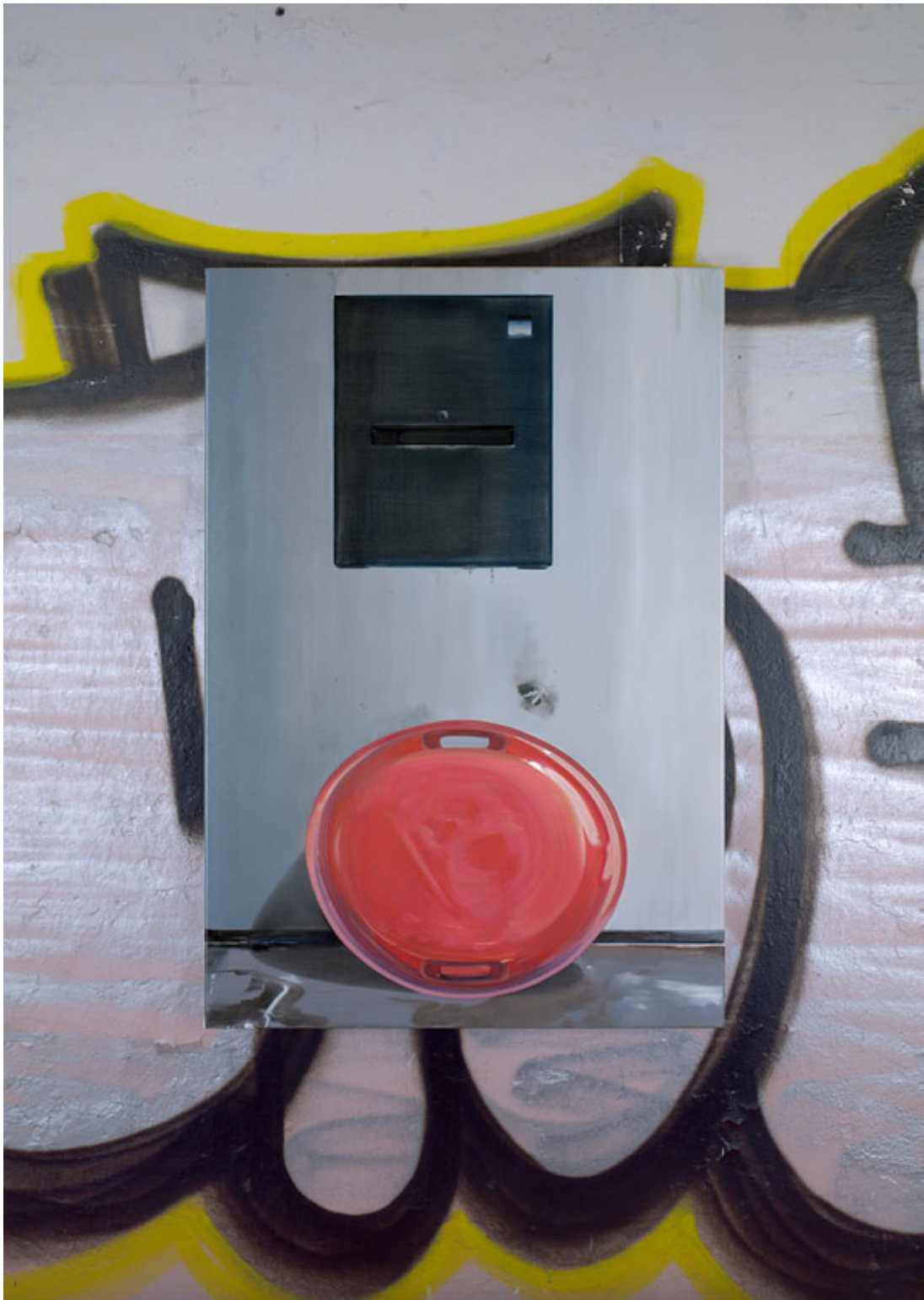
Graffiti mit rotem Deckel , 2012 Piezopigmentdruck , Edition 1/5 184 x 131,5 cm